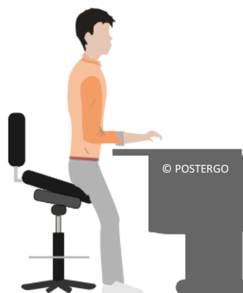
Position assis-debout avec assise inclinable dynamique